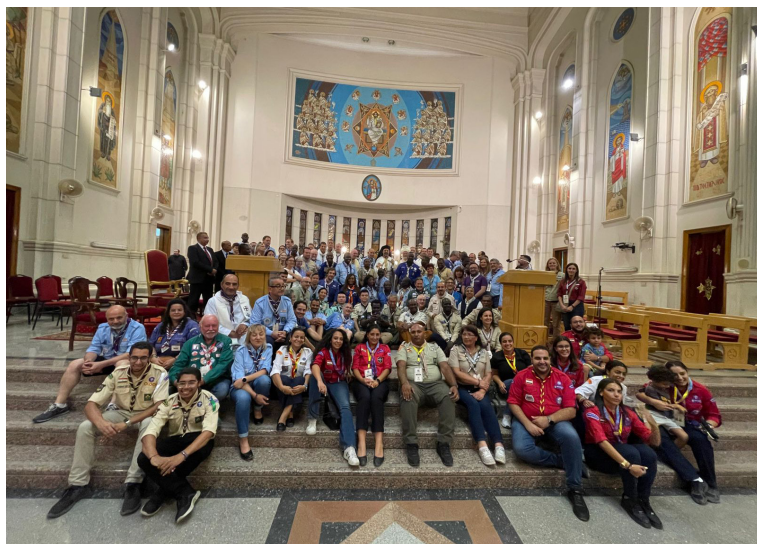
Csoportkép a kairói kopt szertartású szentmisét követően

A küldöttgyűlés minden napján volt szentmise. Első nap kopt (ez a rómaihoz képest jelentősen hosszabb, ötórás szertartás volt), a második nap görög-katolikus rítus szerint.