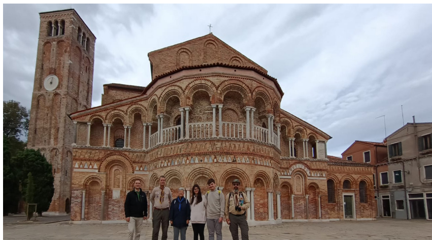
A Táborkereszt zarándokai a Muránói Bazilikánál